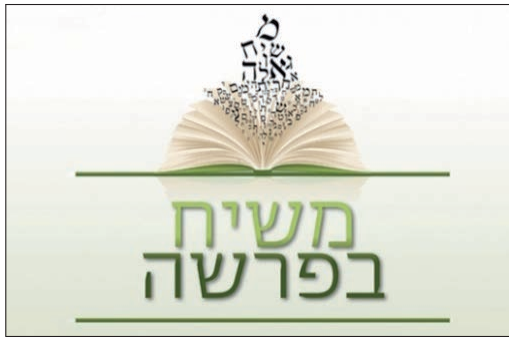
הפרוייקט "משיח בפרשה"

להצטרף לקבלת הקובץ השבועי, שלח מייל לכתובת זו: chanoch@kinus.info .