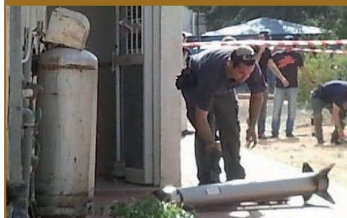
מניסי "צוק איתן". רקטה שנחתה בראשון לציון, סנטימטרים ספורים, ממצבור בלוני גז. בחסדי השי"ת נמנע פיצוץ שעלול היה להיות קשה