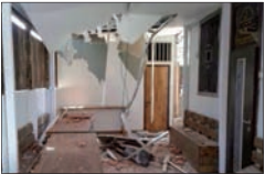
טיל בבית כנסת חב"ד בתל אביב

כששלוש שטרית, בן 77 מבאר שבע, התעורר באותו יום חיכתה לו הפתעה במחסן: שרידי רקטה שנפלו בעיר זרעו