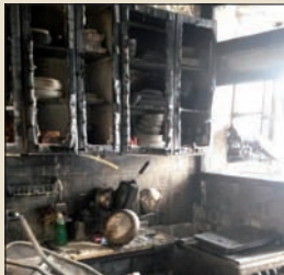
השרפה בבית משפ' שור

שהאש לא תפרוץ מחדש וחזרו לתחנת האם, האמבולנסים פינו מי מהשכנים שחש ברע כתוצאה משאיפת העשן, והסתלקו מהזירה גם כן. עימהם נעלמו אחרוני הסקרנים, כאשר