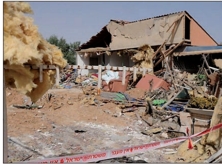
נס בבאר שבע - הבית נחרב, ללא נפגעים

"על ניסך, ועל נפלאותיך, ועל ישועתך" - ועצם ההודיה על הניסים - מזרזת את הנס הגדול מכולם - הגאולה האמיתית והשלמה.