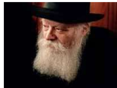
РЕБЕ ШЛИТА КОРОЛЬ МОШИАХ

Будущее Ближнего Востока находится в руках суверенных наций, готовых брать ответственность за свой регион. «Соглашения Авраама» — это не статичный документ, а живая дипломатия, которая в конечном итоге меняет саму структуру регионального взаимодействия, направляя её к развитию, стабильности и приближению Освобождения.