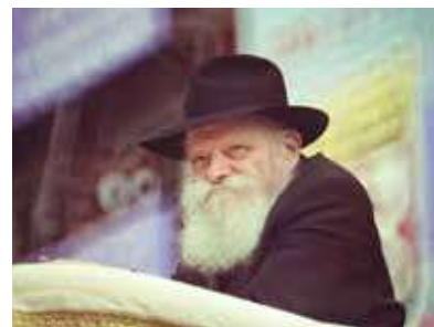
РЕБЕ ШЛИТА КОРОЛЬ МОШИАХ