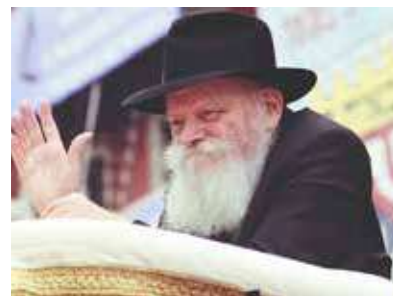
РЕБЕ ШЛИТА КОРОЛЬ МОШИАХ

Все происходящее сегодня — от падения тиранов до чудесного спасения евреев — свидетельствует о том, что время Геулы близко как никогда, и свет истины окончательно пробивается сквозь тучи мировых конфликтов. В эти судьбоносные дни мы воочию наблюдаем, как силы зла теряют опору, подготавливая мир к долгожданному раскрытию Мошиаха.