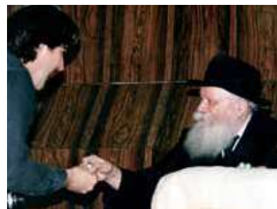
РЕБЕ ШЛИТА КОРОЛЬ МОШИАХ

В конечном счёте, речь идёт не только о трёх странах. Речь идёт о противостоянии двух моделей: порядка против хаоса, ответственности против агрессии. И в этом противостоянии Израиль сегодня стоит в первом ряду — не как наблюдатель, а как опора всего региона.