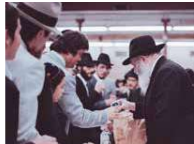
РЕБЕ ШЛИТА КОРОЛЬ МОШИАХ

В наше время, после всей той грандиозной работы еврейского народа на протяжении всех поколений, нам удалось достигнуть совершенства по выбору искр, весь мир уже готов и ждет наступления Освобождения. И, согласно тому, что Ребе Король Мошиах сообщил нам, мы завершили уже всю работу, включая и работу по выбору искр — «аводат а-бирурим», и даже пуговицы уже начищены.